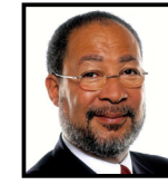
Richard Parsons 理查德·帕森斯 普罗维登斯股本合伙人公司 (Providence Equity Partners LLC) 高级顾问；花旗银行前主 席；曾任时代华纳CEO