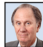
David Bonderman 大卫·邦德曼 德州太平洋集团 (TPG) 创始合伙人