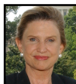
Carolyn Maloney 卡罗琳·莫隆尼 纽约第十二选区众议员